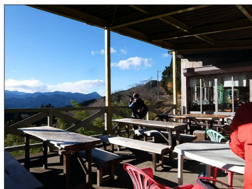
014武甲山も見える. jpg 2022. 12. 18 13:49:06