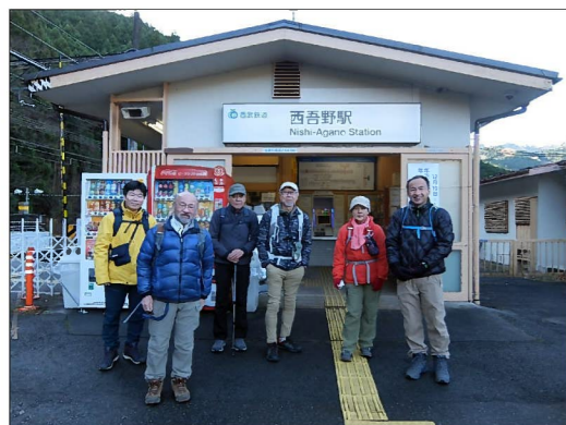
001西吾野駅. jpg 2022. 12. 18 09:28:55