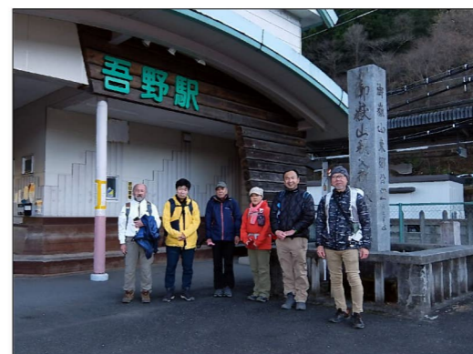
017吾野駅に到着. jpg 2022. 12. 18 15:01:35