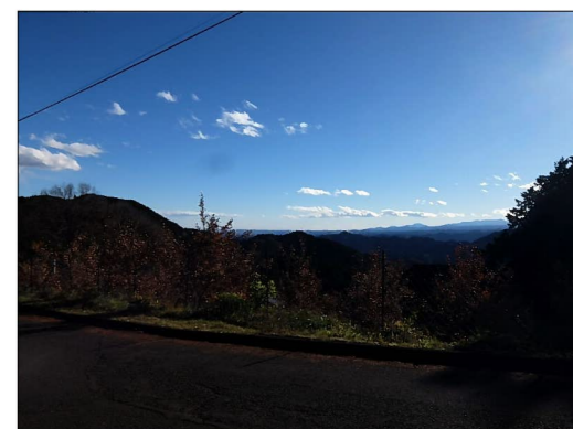
013大山が見える顔振峠. jpg 2022. 12. 18 13:40:29