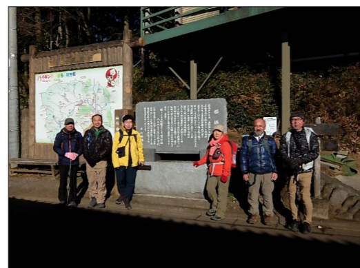
015顔振峠に勢揃い. jpg 2022. 12. 18 13:57:17