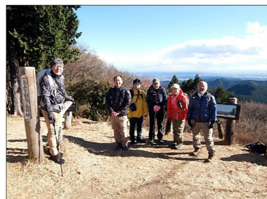
010関八州見晴台2. jpg 2022. 12. 18 12:29:28