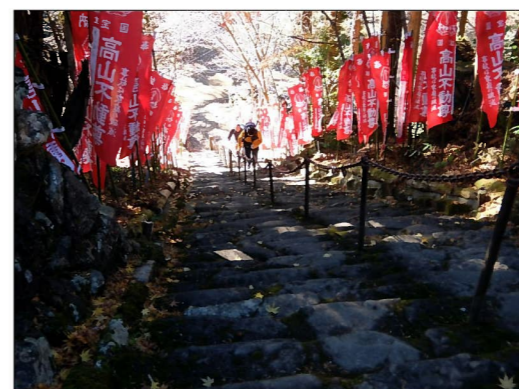
006石段をダッシュ. jpg 2022. 12. 18 10:57:02