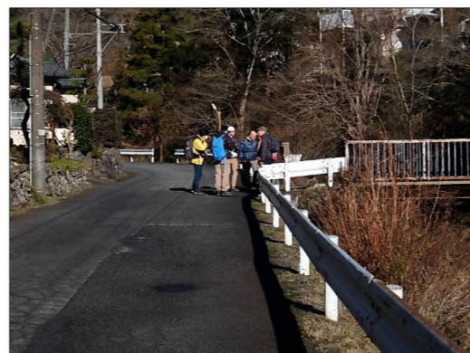
003登山口の分岐. jpg 2022. 12. 18 09:48:57