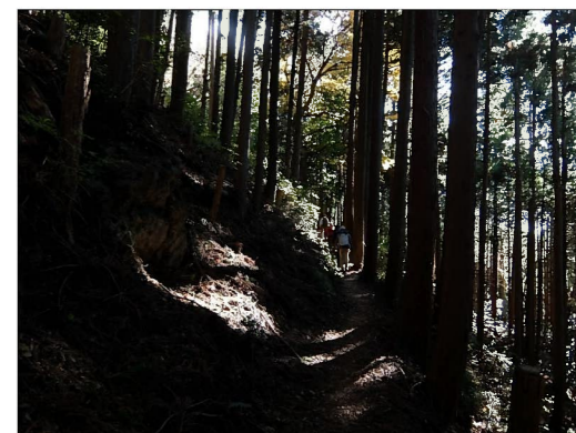
004木漏れ日. jpg 2022. 12. 18 10:49:57