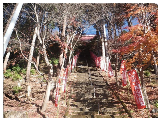
006高山不動尊石段. JPG 2022. 12. 18 10:56:31