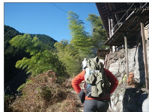
004続く登り. JPG 2022. 12. 18 09:52:10