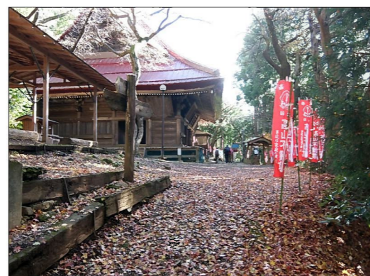
007高畑不動尊本堂. jpg 2022. 12. 18 10:55:57