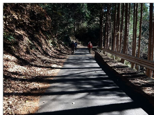
011本隊は舗装道路で移動. jpg 2022. 12. 18 12:59:12