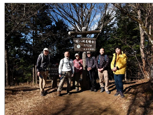
008関八州見晴台. jpg 2022. 12. 18 11:35:44