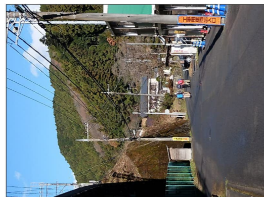
002登山口を目指す. jpg 2022. 12. 18 09:47:41