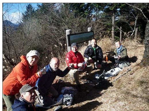
009関八州見晴台で大休止. jpg 2022. 12. 18 11:43:28