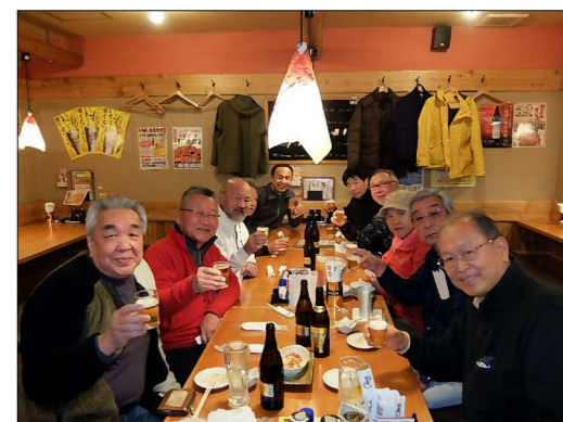
018忘年会. jpg 2022. 12. 18 16:01:22