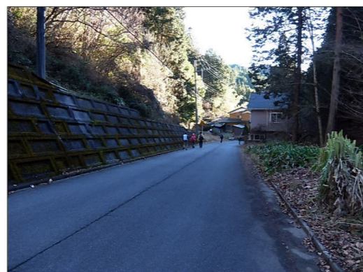
016舗装の長い下り. jpg 2022. 12. 18 14:37:31